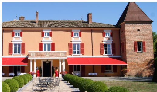
L'Hôtel du Bois Blanc.